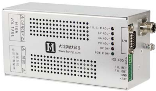
HXM系列 X-光机专用高压电源